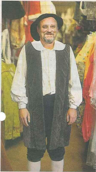
Eher unauffällig: dunkle Schaubе mit passendem Baret.