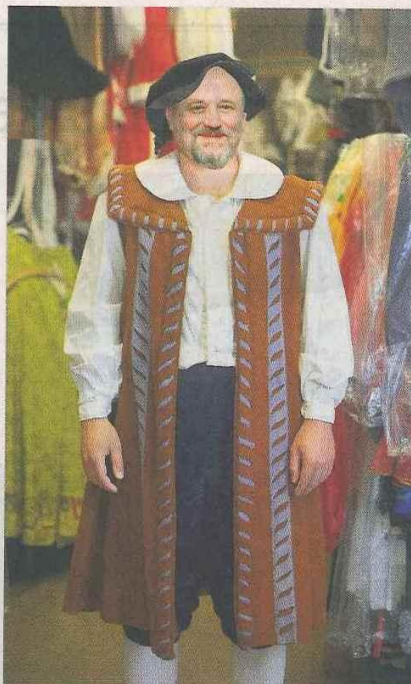
Mit dieser Schaubе und dem dunklen Baret würde der OB einen Farbtupfer setzen.